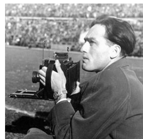
Prof. Erich Lessing Jahrhundertfotograf